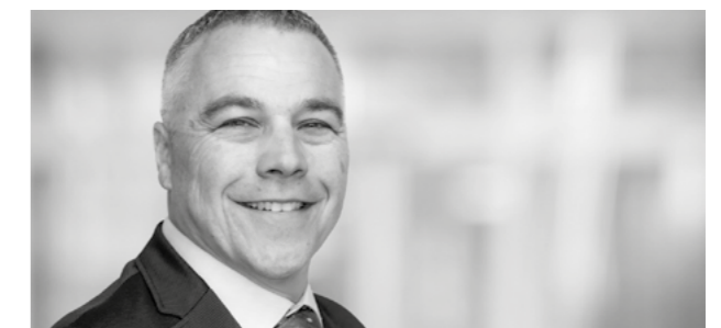
Roland Bon Polizeitechnik und Infrastruktur